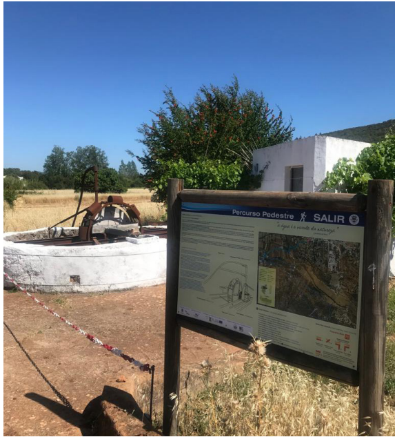
FIGURA 4. Percorso pedestre Rota da Água, Salir.

da Figueira, antigo poço há algumas décadas coberto com laje e munido de roda manual para extração de água, tem um dispositivo muito particular que permite adaptar-se à intermitência da água (torrencialidade e escassez). O seu carácter social de local associado tradicionalmente ao encontro, convívio e estadia foi reforçado, tendo sido equipado com mesa e bancos.