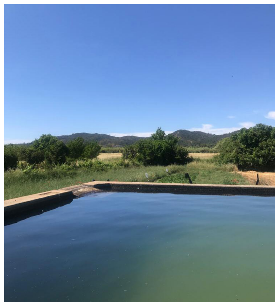
FIGURA 3. Tanque de armazenamento de água para rega, Salir, Rota da Água.

recurso tinha de “buscar-se, ao lombo dos burros ou em carros de muars, em grandes cântaros de barro, às vezes a léguas de distância” (Ribeiro, [1945] 1991: 162). Sempre a água (ou a falta dela) como uma das expressões mais identitárias da paisagem meridional portuguesa, também ela inspiradora da poesia de Eugénio de Andrade ([1974] 1983: 35) que sobre o Sul escreve “Pelo azul da pedra vê-se que é verão/à beira do tanque os aloendros devem estar em flor/as águas refletem o silêncio” (Figura 3).