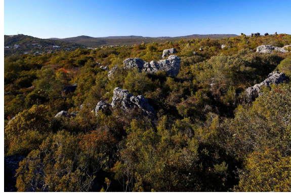
FIGURA 1. Megalapiás da Varejota, Loulé. Formações cársicas e vegetação típica das zonas calcárias.

Nas paisagens cársicas, que correspondem a zonas de infiltração responsáveis pela alimentação dos aquíferos, o substrato geológico calcário é lentamente esculpido pela ação da água que, ao infiltrar-se e arrastar consigo material mineral, cria um rendilhado de fissuras e cavidades de diferentes formas e dimensões. Algumas destas formações estão ocultas no subsolo, como as grutas e os algares, tendo outras expressões visíveis à superfície, como as dolinas (concavidades) e os lapiás e mega-lapiás (saliências), para cujas formas invulgares a tradição popular encontrou designações variadas como “pia silveira” (dolina), “elefante”, “esfinje” ou “cabeça-de-velha” (mega-lapiás) (Figura 1).