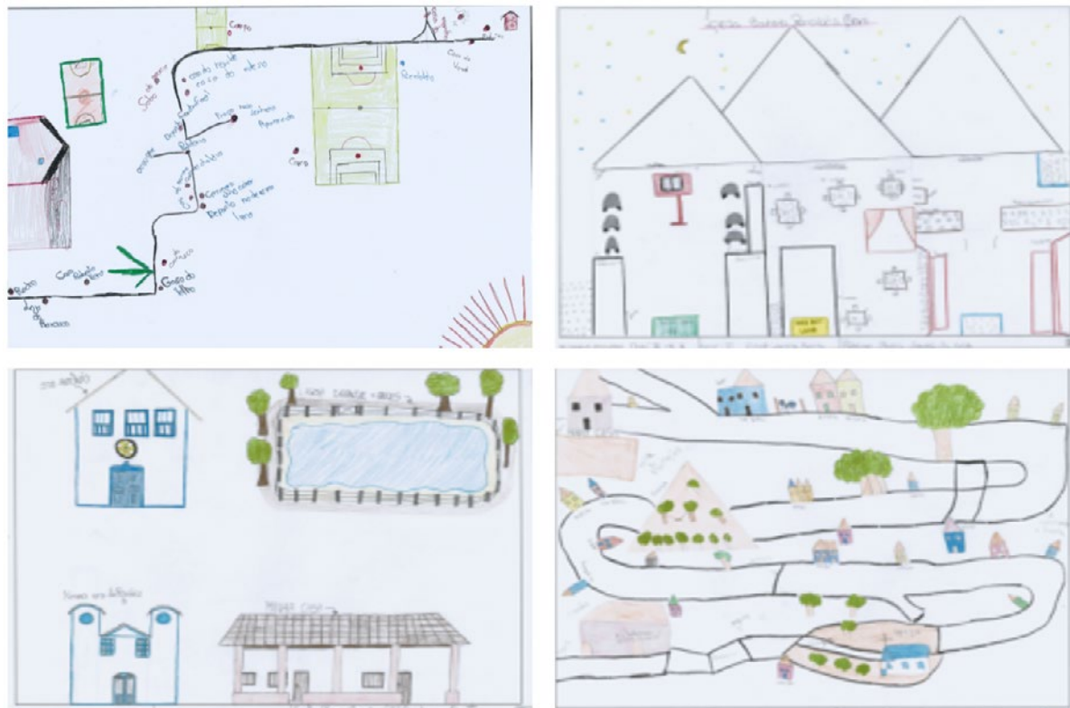
Figura 2. Recortes de desenhos produzidos na oficina de mapa afetivo.