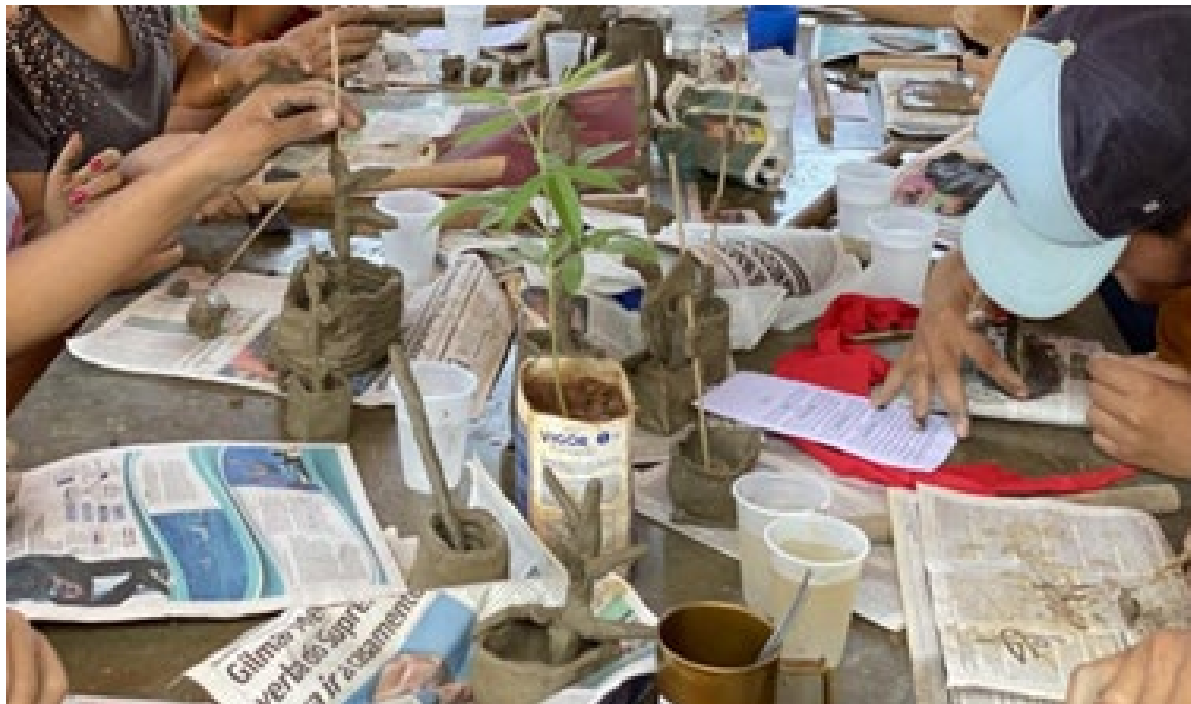
Figura 6. Oficina de modelagem de ícones em argila – Morro da Garça.