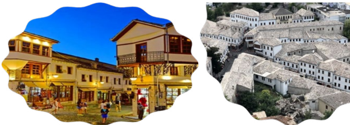
Figure1. Gjirokaster, Albania.

This passage is a classic in Albanian literature, traditionally taught by reading it, commenting on it, mentioning a few themes of the novel and how they align with the social context in which the novel is set, which, let's admit it, can be quite boring for most students who are just passive recipients of the information provided by the teacher. What could be an alternative? How about taking the students to see in real life what the city described looks like, while walking through its cobble streets following the footsteps of the characters in the narrow alleys and reading passages from the book? Then, we could stop at the writer's house, sit on the wide window sill where he would spend most of his day writing, and look through the window where he watched life pass by.