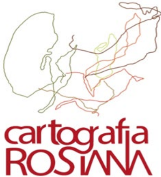
Figura 5. Esboço da marca do projeto Cartografia Rosiana .

Rosiana . Buscou-se também explorar as potencialidades gráficas dos diferentes temas agrupados em linhas e dos “marcos territoriais” (do Museu Casa Guimarães Rosa) distribuídos pela região. Utilizou-se ainda os mapeamentos realizados por Viggiano (1974), Toledo (1982) e Bolle (2004), que se arriscaram a desvendar e a mapear as rotas percorridas pelo personagem Riobaldo, na obra Grande Sertão: Veredas . Esses mapeamentos sobrepostos formaram um desenho impactante, único e pleno de significados, evocando uma sensação de movimento, fluxo, travessia, influenciando a escolha do traçado dessas rotas para a composição de um primeiro esboço da marca Cartografia Rosiana , apresentado na Figura 5.