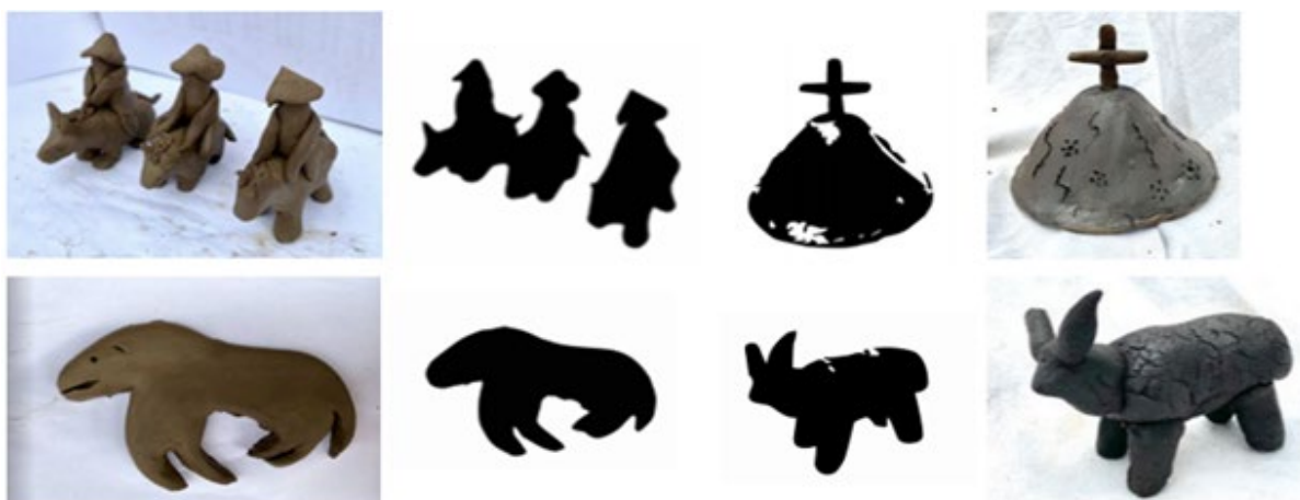
Figura 7. Representações em argila e respectivos esboços dos ícones.

No contexto do design , esse modo de produção colaborativa da iconografia acentuou aspectos significativos do lugar, contribuiu para a integração da comunidade ao projeto e articulou sentidos das experiências locais em rede global da comunicação. As oficinas funcionaram como um instrumento de contato de um saber de si na relação com o territó-