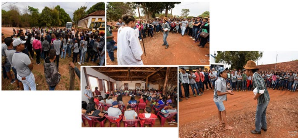
Figura 3. Encenação e narração durante o evento do intercâmbio em Morro da Garça e Campo Alegre.

Na excursão de intercâmbio, os estudantes de Lagoa Bonita foram recepcionados na Casa de Cultura do Sertão, em Morro da Garça, pelos estudantes e professores de Campo Alegre, bem como pela gestão municipal de Morro da Garça e pela equipe do projeto de extensão. Foi realizada uma caminhada pela cidade, com encenação de trechos da novela O Recado do Morro por jovens contadores de histórias locais. Em seguida, os estudantes e professores das duas escolas, a gestão municipal de Morro da Garça e a equipe do projeto de extensão se encontraram na Escola Municipal Carlos Pereira Mariz, no distrito de Campo Alegre, para um almoço de confraternização oferecido pelos anfitriões. O almoço foi seguido de encenação de outros trechos da novela O Recado do Morro pelos estudantes da escola do distrito de Campo Alegre e de brincadeiras com e entre os estudantes das duas escolas, conduzidas pelos professores e pela equipe do projeto. Em síntese, essa excursão proporcionou o encontro entre estudantes e professores das duas escolas e a identificação entre realidade e ficção. Na Figura 3 são mostradas fotografias da encenação e narração dessa novela, na sede do município de Morro da Garça e no pátio da escola do distrito de Campo Alegre.