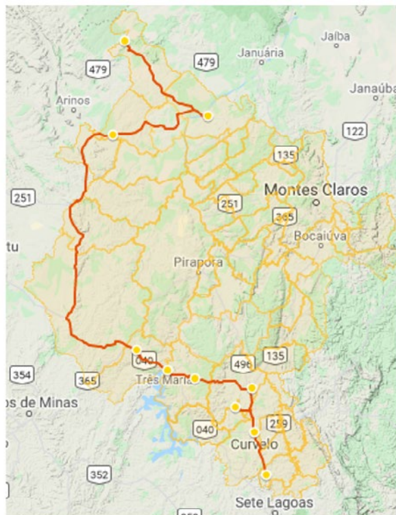
Figura 4. Esboço de rota literária rosiana por “marcos territoriais” do Museu Casa Guimarães Rosa.