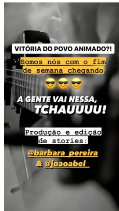
Figura 4. Story publicado em 17 de setembro de 2021, com imagens e música ao fundo do cantor Lil Nas X.

Ferrés e Piscitelli (2015) trazem alguns indicadores como capacidade de extrair prazer dos aspectos formais e sensibilidade para reconhecer exigências mínimas de qualidade dentro da dimensão da estética. Apesar de se utilizar de ferramentas do próprio Instagram para a construção dos stories , alguns conteúdos passam por um processo de edição antes de serem levados à plataforma, visto que alguns efeitos em vídeos e imagens só são possíveis por meio de outros dispositivos, sejam programas em computadores ou outros aplicativos. Esta dedicação do Estadão com a qualidade visual do conteúdo demonstra uma competência estética, que pode ser incentivada entre os seguidores do veículo no Instagram.