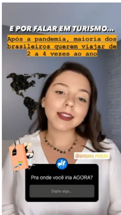
Figura 2. Adesivo dos stories permitem que seguidores interajam com autor de publicação; neste exemplo do dia 16 de setembro, o Estadão convida os usuários a comentar lugares que gostariam de ter como destino em uma viagem.

A interatividade está ligada a uma “transferência de poder do meio para os seus leitores” (Rost, 2014, p. 55), ocorrendo em diferentes graus e por dois ramos diferentes, definidos pelo autor como “interatividade seletiva” e “interatividade comunicativa”. Enquanto a primeira se trata das possibilidades de navegação e leitura, a segunda está relacionada à comunicação e expressão dos leitores, podendo gerar um conteúdo que venha a se tornar público. O exemplo que citamos na dimensão de “tecnologia” de Ferrés e Piscitelli (2015), do incentivo do Drops ao registro de imagens durante a imunização dos seus seguidores e postagem dessas publicações, poderia se aplicar ao segundo ramo abordado por Rost (2014). Entretanto, as demais ferramentas utilizadas pelo Estadão demonstram estar no primeiro âmbito, onde os processos de interações são mais reativos e limitados ao que é oferecido pela interface do Instagram.