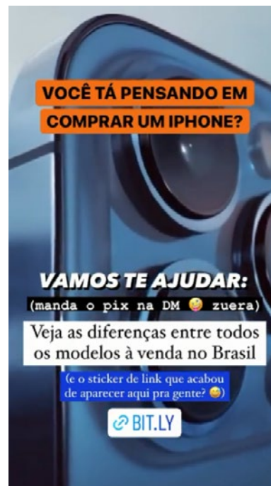
Figura 1. Publicação do dia 16 de setembro que alerta sobre a mudança para acessar a reportagem completa do Estadão.

Já em relação a capacidade de elaborar e manipular imagens e som, como vimos anteriormente, o próprio aplicativo do Instagram permite que o usuário execute essas ações. Com o avanço da vacinação contra a Covid-19 no Brasil, o Drops passou a pedir que seus seguidores registrassem o momento em que fossem imunizados, por vídeo ou foto, e enviassem para o perfil do jornal no Instagram. Eventualmente, esse material é publicado durante o Drops . Na semana analisada, isto ocorreu uma vez, no dia 16 de setembro, com diversas fotos passando seguidamente em um story . Com isto, o incentivo do Estadão para que seus leitores produzam algum tipo de conteúdo se limitou a este ponto da vacinação, não sendo identificada nenhuma outra ação deste tipo ao longo da semana analisada.